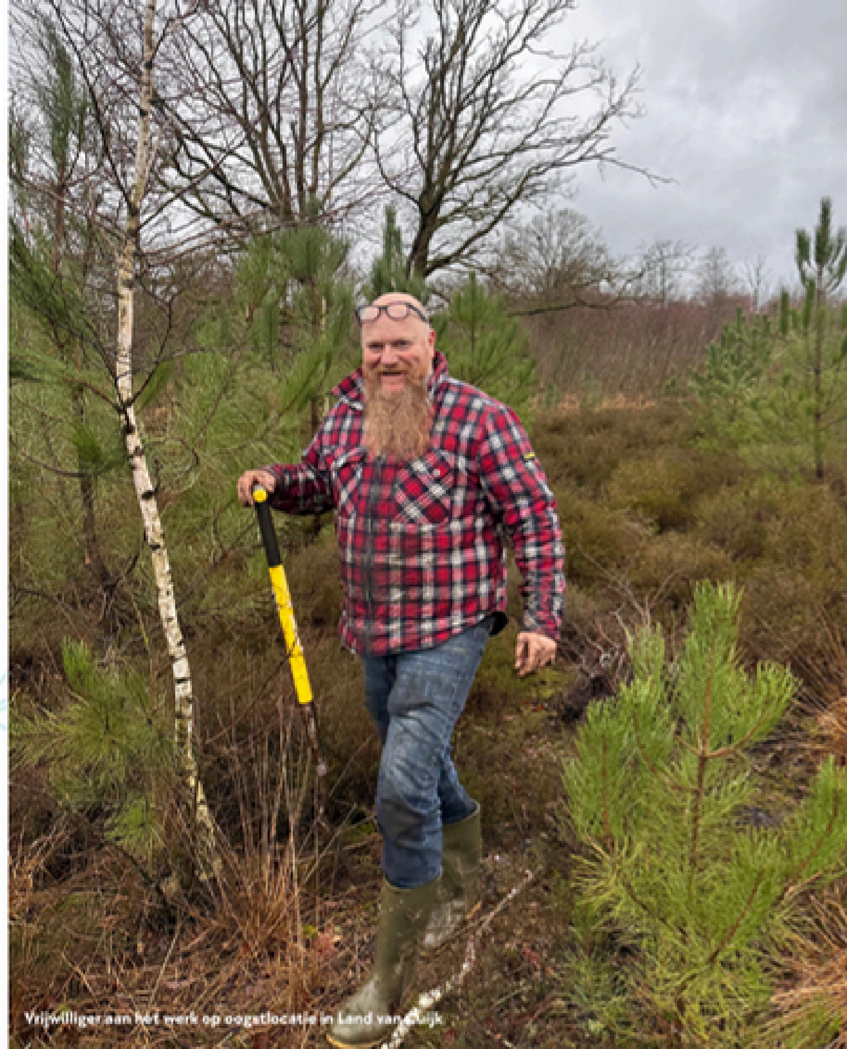
Vrijwilliger aan het werk op oogstlocatie in Land van Gooij

Duizenden vrijwilligers de hele winter de handen uit de mouwen om jonge boompjes en struiken op de ene plek te verzamelen en bundelen, te vervoeren en vervolgens op een andere plek weer te planten waar zij een betere kans hebben een volwassen boom te worden. Menig boerderij, achtertuin en voedselbos ontving gratis inheemse bomen en struiken. Hiermee staat het totaal aantal bomen en struiken dat Meer Bomen Nu een tweede kans heeft gegeven al op 3 miljoen. Indien we internationale campagnes meenemen staat de teller al ver boven de 3 miljoen. Bovendien geeft de campagne hoop en handelingsperspectief aan mensen met klimaatzorgen.